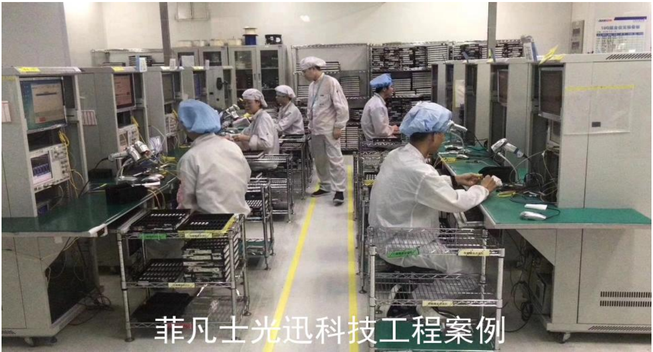
菲凡士光迅科技工程案例