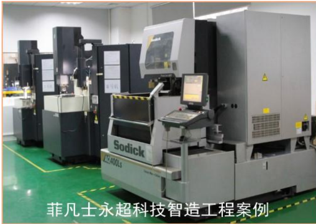
菲凡士永超科技智造工程案例