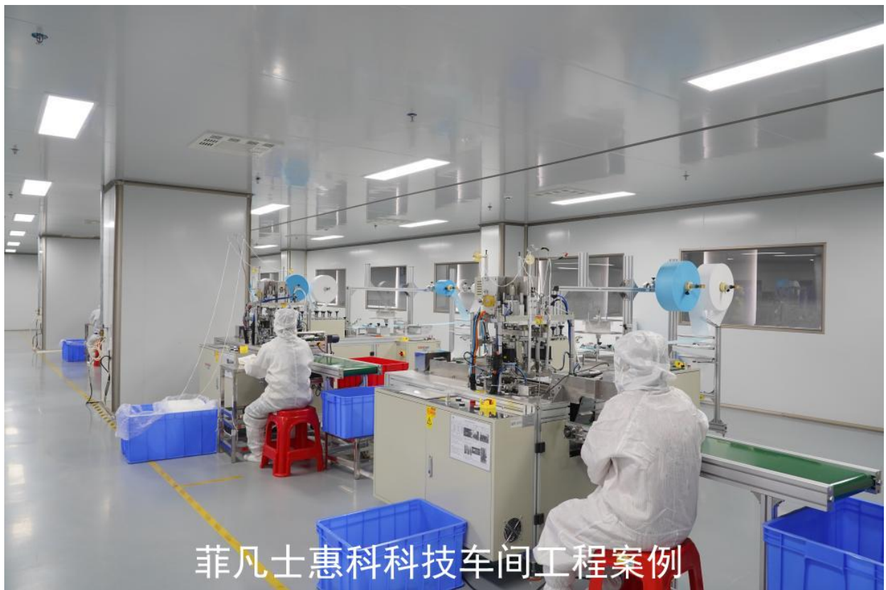
菲凡士惠科科技车间工程案例